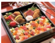
雛弁当 2,700円(4個〜、少数応相談) ※3日前まで要予約