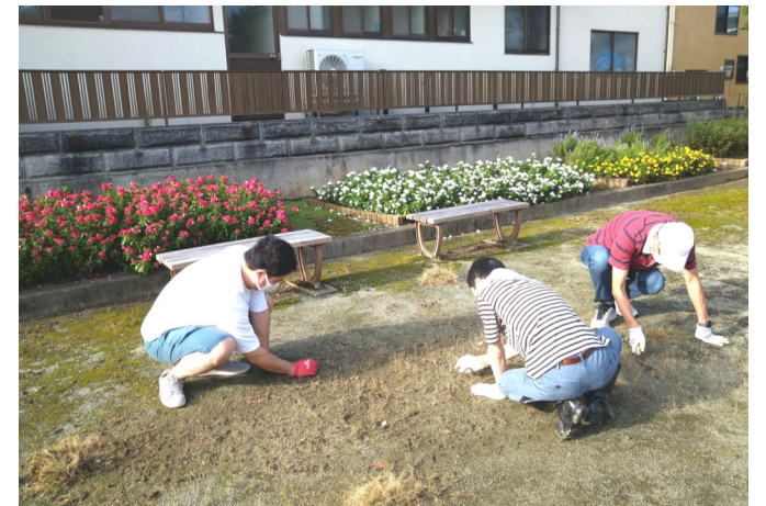
コロナ禍で諸事業が行えませんが、日曜の早朝、清々しい中での公園清掃は、ストレス発散と町内の情報交換に最適です（三日町）