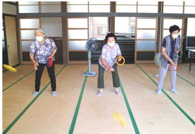
悠遊会女性部輪投げ、楽しんでいます（一日町）