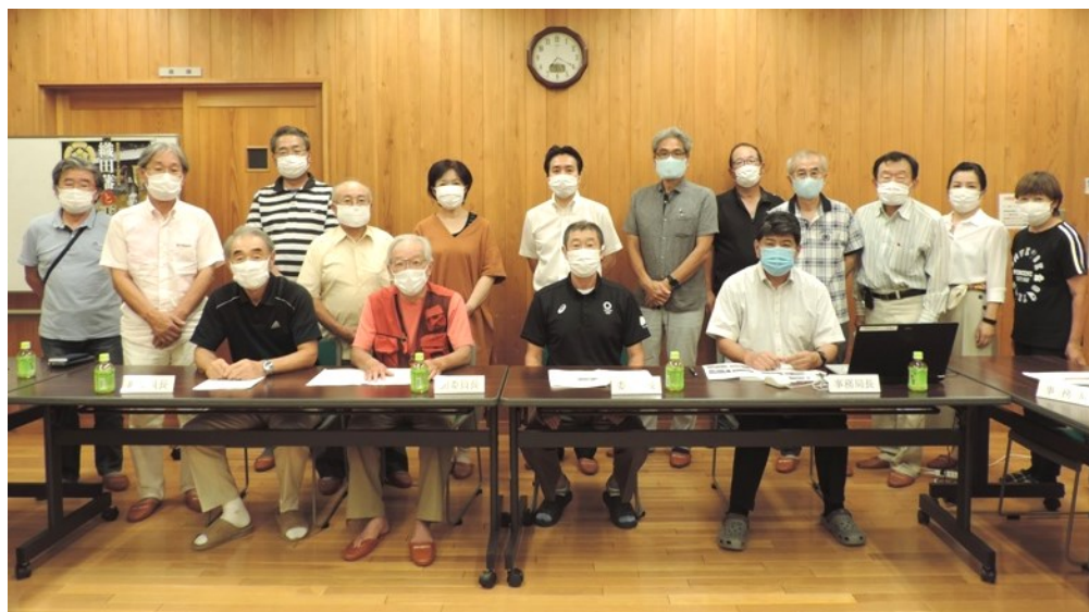
会議は、新型コロナウイルス対応の「新しい生活様式」で 行っております。