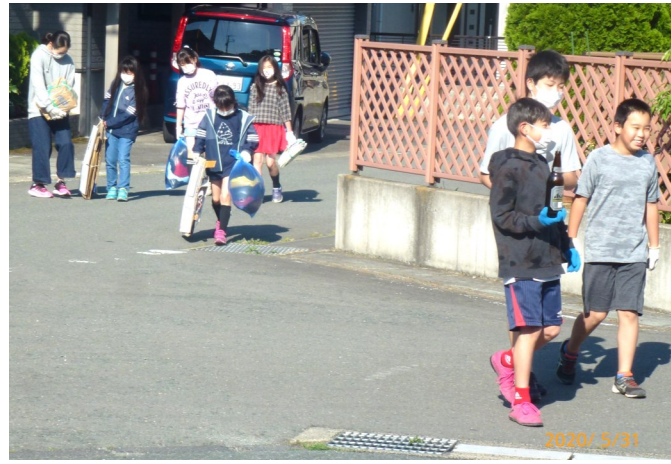
子どもたちも元気に資源回収（上北目）