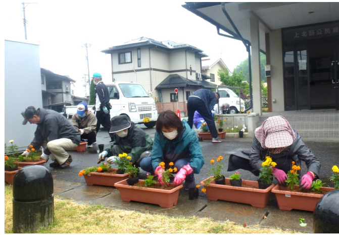
コロナに負けない花いっぱい運動（上北目）