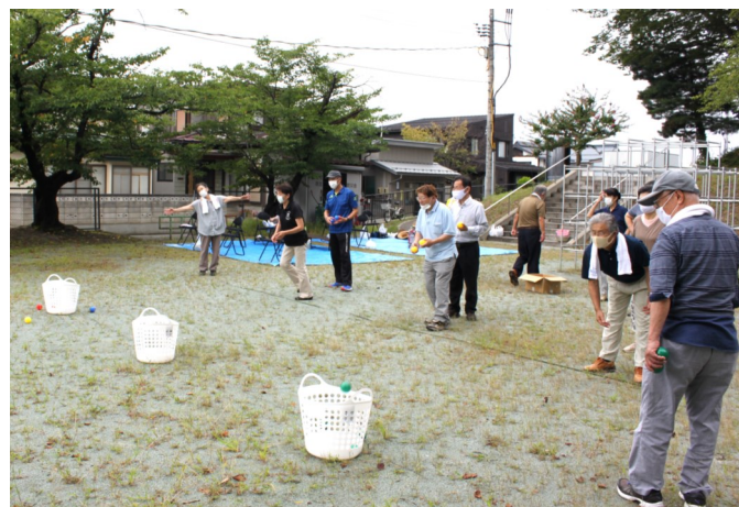
ボールゲームで誰が優勝するか、熱戦の始まりです（五日町）