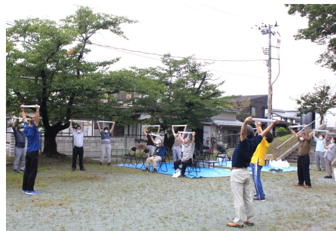
今年最初の「いきいきサロン」ストレッチ指導は梅津南部公民館長です（五日町）