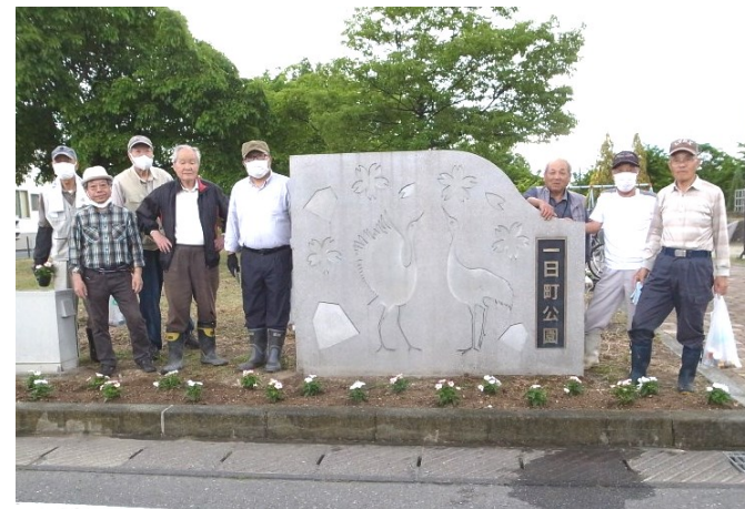
悠遊会、一日町公園で花いっぱい（一日町）