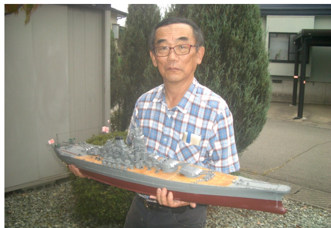
フェスティバルの作品展示も中止で残念な 武田駅西分館長（駅西）