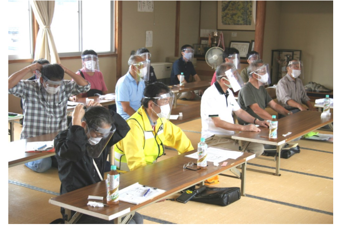
コロナ禍中の防災訓練、フェイスガード材料費151円（田鶴町）