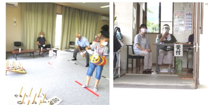
ソーシャルディスタンスを守って輪投げ大会が実施されました（南小畑）