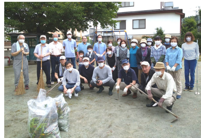
月第2日曜日は三日町公園清掃デーです（三日町）