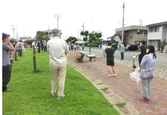
町内清掃にコロナ禍の中でも、きれいにす るために80人もの方が参加（南町）