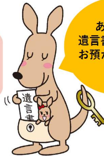
遺言書ほかんガル

法務局手続案内予約サービス専用ページ https://www.legal-ab.moj.go.jp/houmu.home-t/