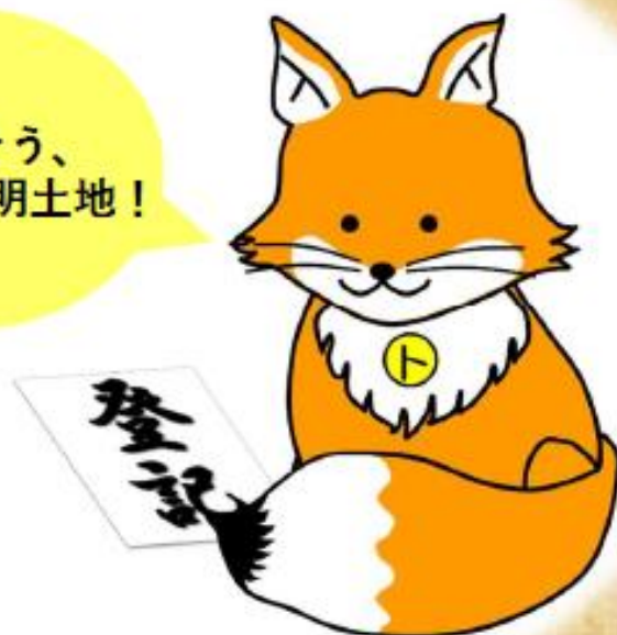
不動産登記推進イメージキャラクター 「トウキツネ」