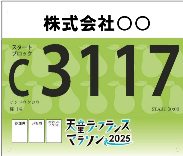
前面：ハーフマラソン