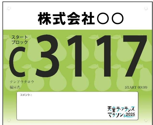
背面：ハーフマラソン

ナンバーカードサイズ 240mm×200mm (内、広告部分 240mm×40mm)