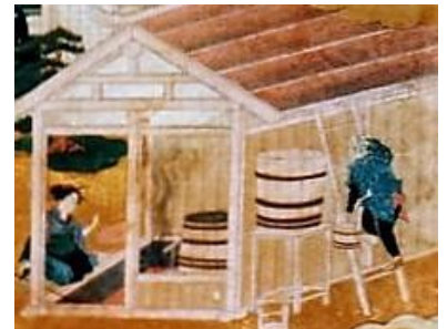
絵馬「薄荷栽培製法之図」(部分)

明治 23 年(1890)、山形市錦町神明神社に絵馬「薄荷栽培製法之図」(以下、絵馬)が奉納された。(現、山形市郷土資料収蔵所蔵)絵馬には、薄荷の蒸留に使用する大桶や作業する人物が描かれ、上部には「解説書」がしたためられている。それには、「薄荷 内国紫薄荷正油」、「産地 羽前国北村山郡山口村字大槻 原ノ前」、「平地 壠土(黒土)」、「現今反別及ヒ年度(以下略)」、「薄荷畑仕立方法(以下略)」、「施肥料(以下略)」、「製造法 竈上ニ大桶ヲ載セ乾燥シタル薄荷ヲ其桶中ニ入レ 而シテ外該上ニ鍋ヲ据エ水ヲ入レ其水ノ暖カナルニ從ヒ薄荷油水ヲ得 而シテ之ヲ分析シ真ノ薄荷油ヲ得 所謂焼酎ヲ製スルニ髣髴タリ」、「地位及地価(以下略)」、「收穫ノ高(以下略)」、「耕作反別損益(中略)差引純益惣合計金六百三拾四円五拾銭ヲ得ル」と記されている。