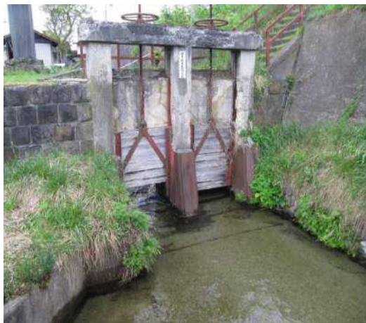
山寺堰取水口(山寺宮崎)

宮城浩蔵の近代法の普及が、天童との水争いの和解に結び付いていたとは興味をそそる話である。