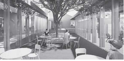
西側増築棟 (中庭デッキ)

入り口にある大きなひさしを屋内空間化し、新たな居場所へ。中庭デッキ、多目的に使えるスペースを設置します。