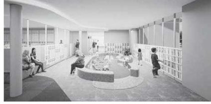
ちびっこプレイス

増築する建物と既存図書館をつなぐ位置に、ちびっこプレイスを設けます。音環境を気にせず利用できます。