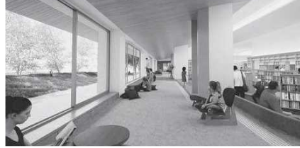
えんがわプレイス

南側に新たに計画するエリアで、靴を脱いでリラックスしたり、窓際の掘りごたつ状のカウンターでじっくり本を読んだりできます。