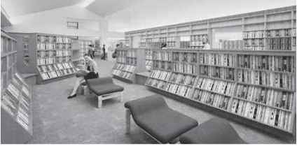
オープンライブラリー

ちょっと腰掛けることのできるベンチャ、じっくり本に向き合うことのできるデスクを新たに配置し、家具もリノベーションします。