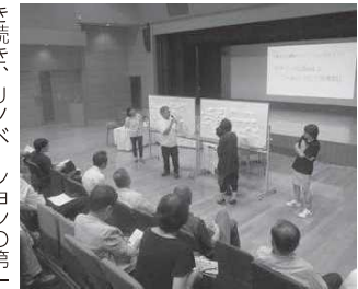
▲皆さんの声を集約