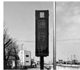
▲LED表示板（イメージ図）