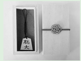
▲将棋の聖地から新生児へ

A 子育てアプリ「コマモル」でのお知らせや、子育てガイドへの掲載、妊婦への健康相談の際に周知を行い、出生届の提出時等に申請をしてもらうほか、電子申請でも受け付ける。