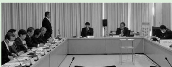
▲分科会方式の審査の利点や課題を巡る

本市議会は、市民の負託に応えられるよう、より良いまちづくりを目指して励んでまいります。