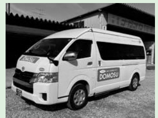
▲市内全域自宅まで送迎

A 現在利用している配車システムは令和8年度までの契約となっており、次に導入する新しい配車システムではAIの導入も考えている。