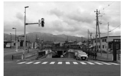
▲工事予定の南部地下道