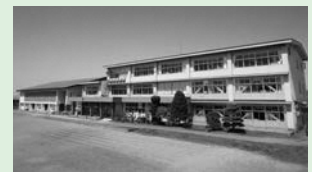
▲複式学級がスタートする荒谷小

A 1人の担任が2学年を受け持つことになるため、複式学級の経験のある教員の配置を県教育委員会に求めている。また、担任をサポートする学習指導員を募集して、授業での支援をしてもらう予定である。