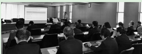
▲ハラスメントを許さない議会に

また、近年の問題としてSNSでの炎上や名誉棄損などの侵害行為、ハラスメントとなる事例などについて、実例の紹介も含めて解説が行われました。首長や議員などによるハラスメントの問題は、新聞等で取り上げられていることもあり、当事者のみならず組織の信頼も大きく損ねる重大な事案になることを改めて理解しました。今後もお一層クリアな議会づくりを目指すことを再確認しました。