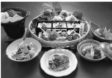
▲地元の旬の食材をふんだんに使った料理

19歳で調理師となり、東京で日本料理の修業を積む。市内の旅館を経て、現在、鎌田本町の旅館で調理長として腕を振るう44歳。全国日本調理技能士会連合会師範、日本調理師連合会師範を取得するなど、調理技術の研さんに余念が無い。平成26年、第32回天童市技能功労者褒賞、第34回日本料理技能向上全国大会日本料理研究会会長賞を受賞。