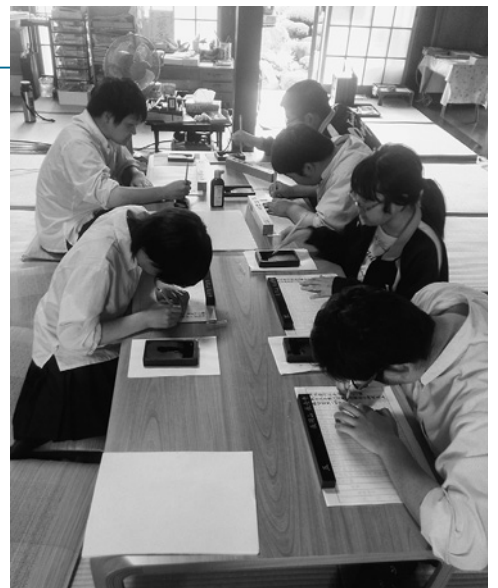
▲心を静めて写経に取り組みました

書道部では、作品を書くだけではなく、書道で使う道具がどのようにならされているか学んでいます。書道は、文字を書くだけではなく、書くときの道具も大切であることを学ぶ ためです。 ことしも、白鷹町にある工房を訪れ、和紙すきを体験しました。ことしで4回目になりますが、何度行っても違う仕上がりになり、生徒一人一人の個性が出ています。その他にも、硯作りの見学や、実際に寺に行つて、写経体験などを行っています。 学校の授業ではできない貴重な体験を通して、生徒とともに学び成長していきたいと思っています。