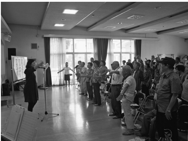
歌に合わせて楽しく体を動かすみなさん