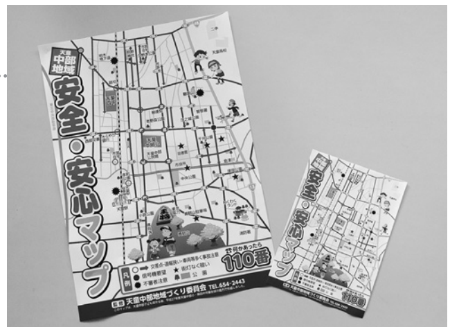
9年ぶりに更新しました

A4版のマップは、天童中部地域全戸に配布したほか、市内の公共施設などにA2版のポスターの掲示をお願いし、防犯活動に役立ててもらっています。