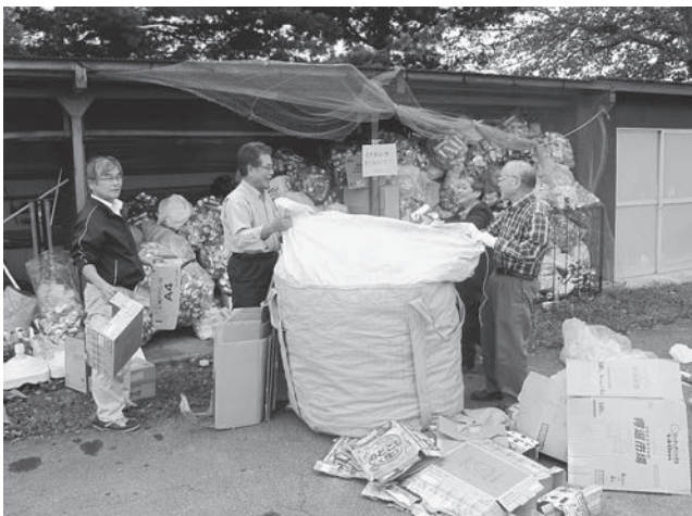
年に数回まとめてアルミを集約します