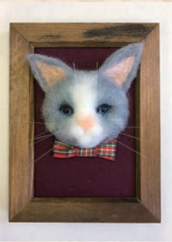
ワークショップ作品例