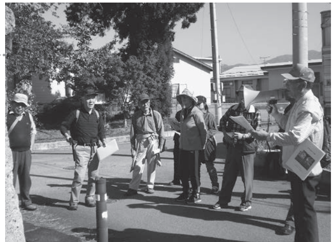
昨年開催した史跡めぐり（清池の石鳥居）

昨年は、冊子を活用して現地をガイドする「長岡地域の史跡めぐり」を初開催し、好評をいただきました。ことしも、7月28日には子どもを対象に、11月3日には一般を対象にした「史跡めぐり」の開催を予定しています。地域内外のみなさんのご参加をお待ちしています。