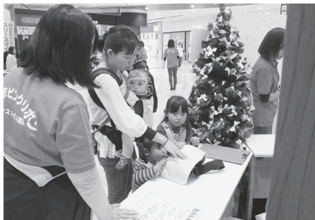
▲ピンクリボン母の日キャンペーンでの啓発活動