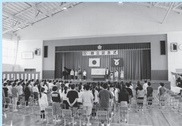
▲第125回創立記念式でみのりっ子憲法を披露

昨 年度、山口小の子どもたち は、なりたい自分に向かって前向きに暮らしをつくらうと、 学校生活の基本的なきまりを条文化しました。そのきまりを、子どもたちは「みのりっ子憲法」と呼んでいます。全部で十三条からなるこのきまりは、各学級会・代表委員会などで積極的に話し合われ、議論を十分に重ねて、ことし2月に公布・施行となりました。 4月27日には、児童会総会が行われました。児童が体育館に集まり、本年度の児童会のスローガンについて話し合いました。その結果、決定されたスローガンは、「みのりっ子憲法を柱に、「オアシ