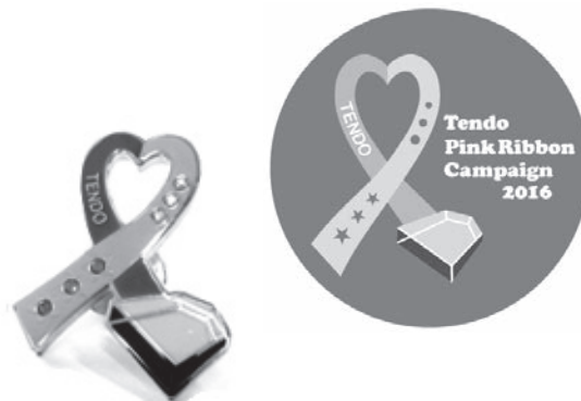
▲ピンクリボンパッチとマグネット