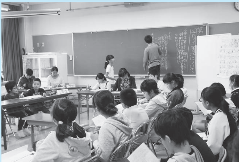
▲代表委員会での話し合いの様子

山口小は、天童市と仙台市を結ぶ国道48号沿いにある全校児童157人の小学校です。果樹栽培や稲作が盛んな地域で、子どもたちはのびのびと学んでいます。今回は、子どもたちが創った「みのりっ子憲法」について紹介します。