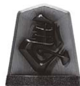
▲本市の技術が詰まった飾り駒 MAIZURU（マイヅル）

馬は、古くから人々の生活に欠 かせない動物として親しまれてき ました。成功や前進の象徴とされ 縁起の良い動物としても知られて います。