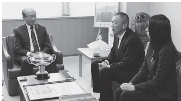
▲受賞後、市長を表敬訪問 (12月1日)

耕作放棄地をなくすために農地を借り受け、130ヘクタールに及ぶ大規模栽培を行っていることや、スマート農業を導入することで省力化を実現し、女性の活躍を推進していることが評価されるなど、家族経営で地域の農業を支える実績が認められました。