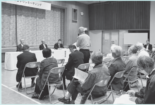
▲各地域で意見交換を実施