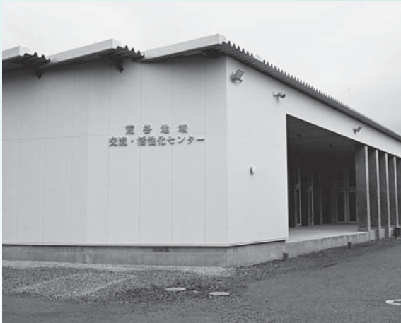
▲完成した荒谷地域交流・活性化センター(市立荒谷公民館)（5月）