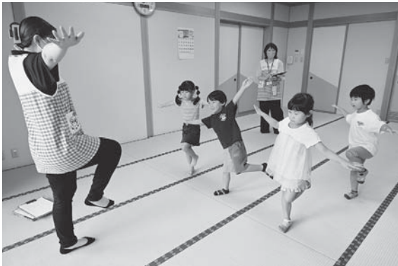
▲5歳児健康診査を開始（7月）