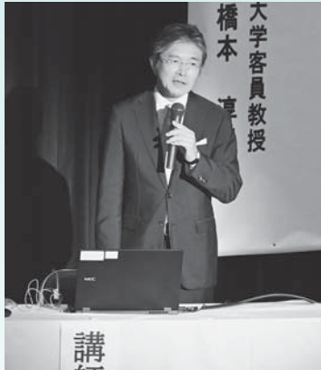
▲水道通水100周年記念講演会を開催（9月）