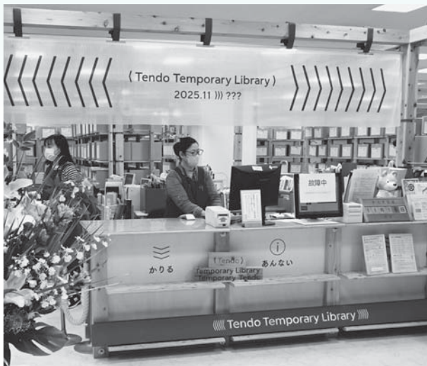
▲パルテ内に仮設図書館を開設（11月）