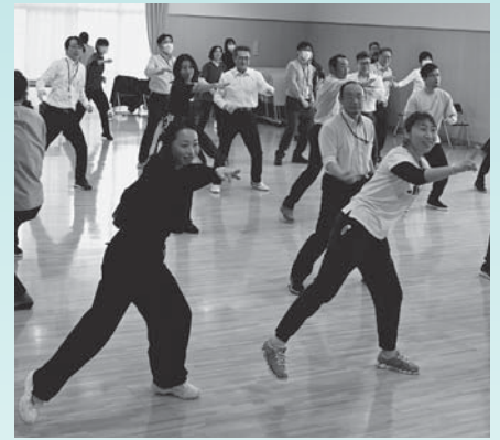
▲王手のリズムで楽しく運動（3月）