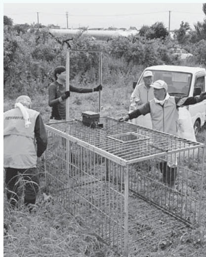
▲鳥獣被害対策に取り組む様子