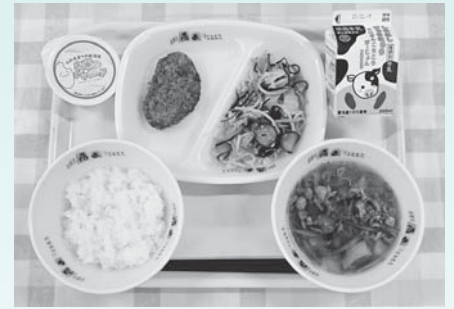
▲小・中学校の給食費を無償化（4月）