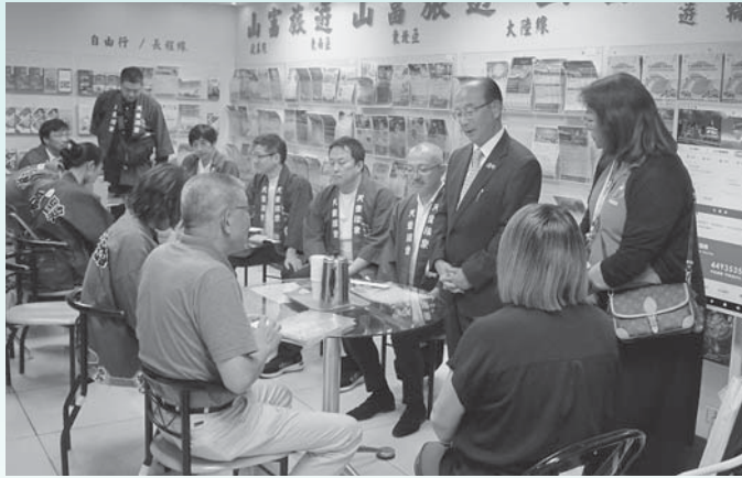
▲天童温泉協同組合と台湾トップセールスを実施（10月）