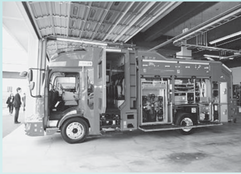
▲新たな機能を備えた救助工作車を導入（10月）