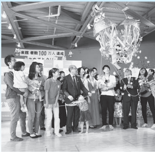
げんキッズが利用者100万人に