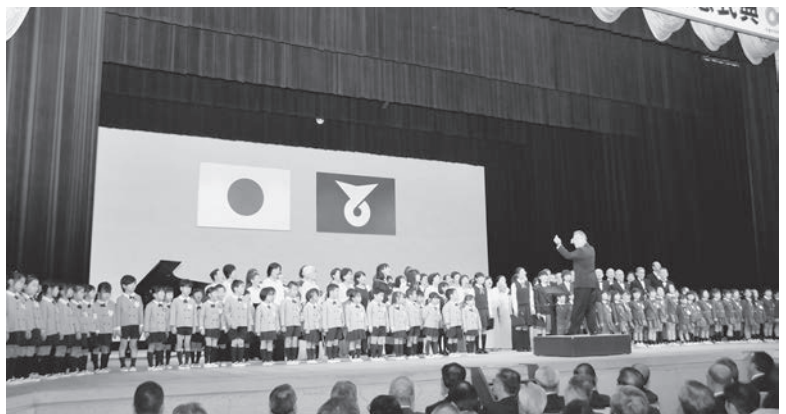
市制施行から60周年、健康都市の実現へ向けて