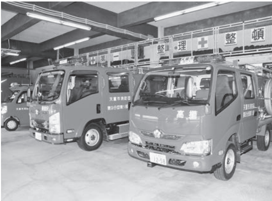
消防団の防災力を向上

ことしは、市制施行60周年の記念すべき年として全国に天童を発信するとともに、快適で安心して暮らせるまちづくりに取り組んだ1年でした。 3月・4月には、天童市消防団への新車両の配備と新たな分団の発足により防災力の向上を図りました。また、本市と山形市を結ぶ出羽高楯橋の開通により市内交通網の整備が一段と促進されました。 8月に行われた夏期巡回ラジオ体操、11月開催のラ・フランスマラソンには多くの方が参加し、運動を通じた健康づくりの契機となりました。 10月に開催した二千局盤来2018では、一会場ですべて同時に行った将棋の最多対局数のギネス世界記録に挑戦し、みなさんの協力により2362局のギネス世界記録を達成。将棋のまち天童が世界に誇る記録を樹立することができました。