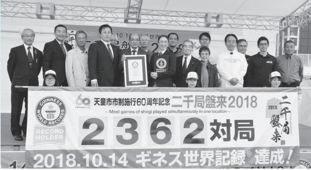
二千局盤来2018では世界に誇る大記録を達成