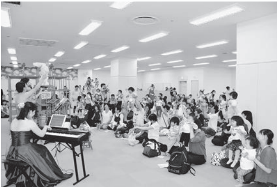
わらべ館がリニューアルし、より快適に