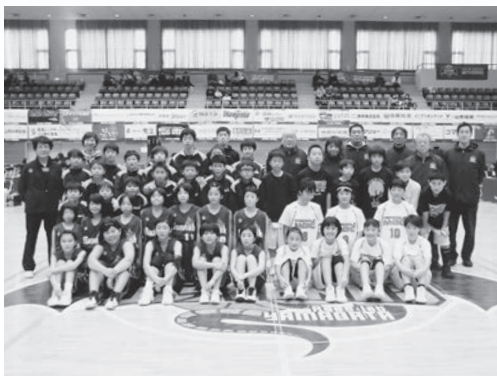
多賀城市との青少年育成交流スポーツ大会