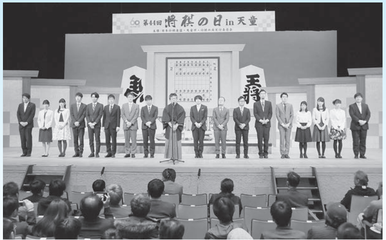
将棋の日では全国に将棋のまち天童を発信