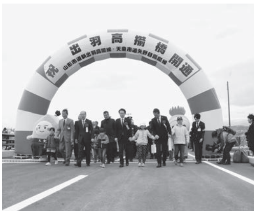
本市と山形市を結ぶ架け橋が完成