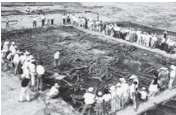
▲西沼田遺跡の発掘調査説明会（昭和60年8月）