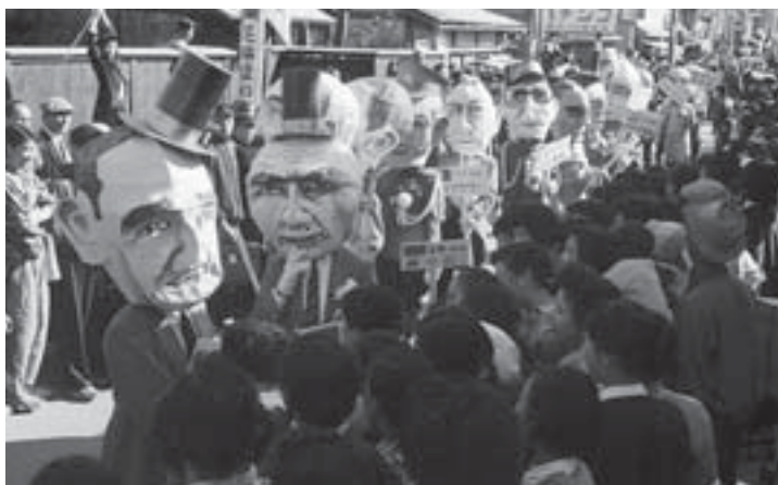
▲市制施行記念仮装行列（昭和33年10月）