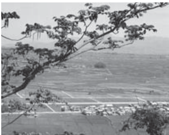
▲舞鶴山から見た天童温泉街（昭和34年5月）

天童市は昭和33年10月1日に誕生し、ことしで60周年を迎えました。60年の間に、都市・生活基盤の整備や産業基盤の整備、教育や福祉の充実などに取り組み、また、時代の変化などにより、まちの姿や私たちの生活は大きく変わりました。60年のあゆみを写真と年表で振り返ります。