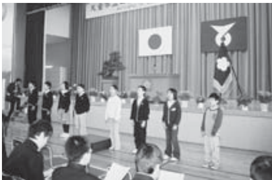
▲田麦野小を閉校（平成18年3月）