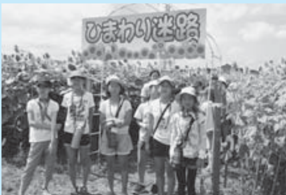
▲一緒にひまわり迷路を体験

めなどの天童ならではの楽しみを満喫しました。夜は干布小の子どもたちの家に四谷小の子どもたちが民泊をして、それぞれの家庭でたくさん話をしながら、さらに絆を深め合うことができました。 最終日の4日目は、干布の名所ひまわり迷路を楽しんだ後、別れを惜しみながら四谷小の児童が東京に帰る姿を見送りました。 46年間、干布と四谷の子どもたちが温かい交流を続けているこの取り組みは、干布地区のたくさんの方々の協力で成り立っています。地域の方々への感謝の気持ちを忘れずに、この交流を大切にしています。