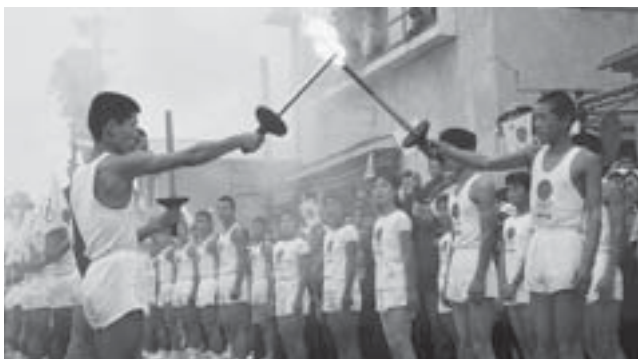
▲東京オリンピックの聖火が市内を通過（昭和39年9月）