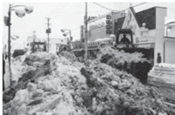
▲32年ぶりの豪雪に除雪は困難を極める（昭和52年1～2月）