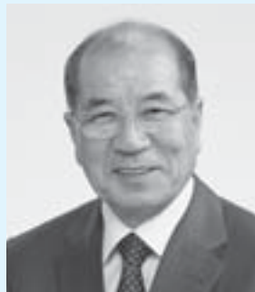
天童市長 山本 信治

まちとして内外から高い評価をいただいております、これは、先人の方々による絶え間ないご努力や、多くの市民のみなさまの貴重なご協力の成果であります。