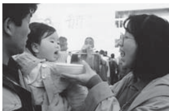
▲第1回天童冬の陣「平成鍋合戦」（平成8年1月）

10月 市総合福祉センターが完成 市の人口が6万人を突破 7年3月 第四次天童市総合計画を策定 7月 有料指定ごみ袋制度を導入 8年1月 第1回天童冬の陣「平成鍋合戦」が開催