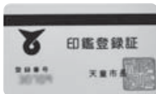
水色の印鑑登録証