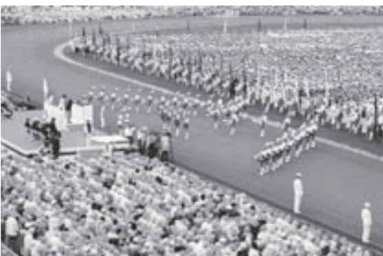
▲べにはな国体を開催（平成4年10月）

5年10月 全国身体障害者スポーツ大会を開催 天童駅周辺が建設省の都市景観大賞を受賞 11月 天童駅前土地区画整理事業が完了 6年2月 在京天童会（現関東天童会）が発足 8月 市スポーツセンター野球場が完成