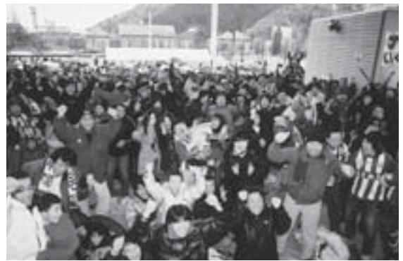
▼モンテディオ山形J1昇格に喜ぶサポーター（平成20年11月）