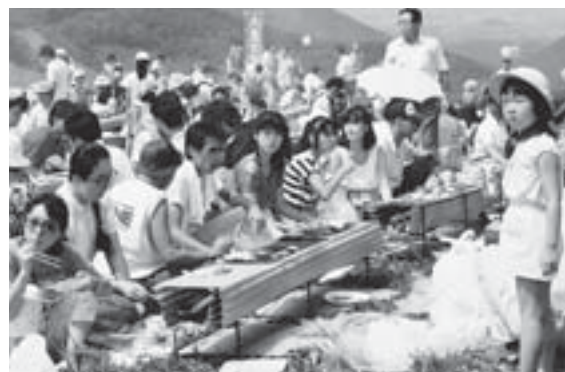
▲現在まで続く天童高原まつり（平成元年8月）