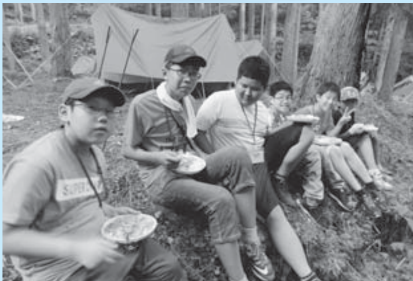
▲自分たちで作るカレーは最高

干布小は、奈良沢・原町・上荻野戸・石倉・出田原・片羽の6つの地域から子どもたちが通っており、全校児童126人の学校です。今回は、本年度で46回目となる新宿区立四谷小との夏の交歓会について紹介します。