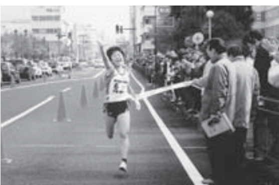
▲県女子駅伝競走大会で天童東村山が初優勝（平成13年11月）