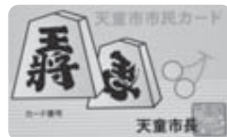
印鑑登録をしていない市民カード