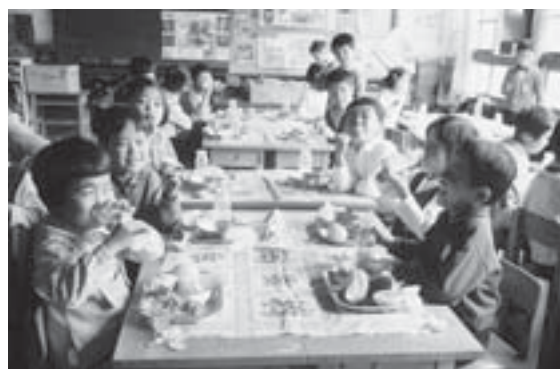
▲学校給食の様子（昭和45年10月）