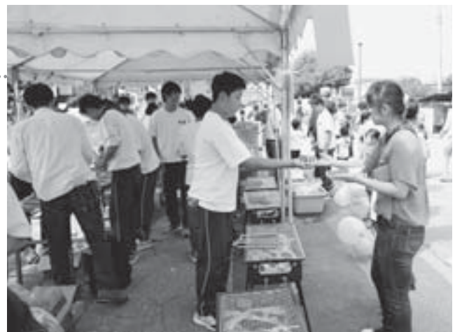
中学生による売店運営の様子

9月2日に第41回蔵増地区レクリエーション大会が行われ、地区内の中学生ボランティアが、かき氷やフランクフルトなどの模擬店の出店や企画種目の考案と運営、進行アナウンスの役割を担い、大会を大いに盛り上げてくれました。こうした活動を裏方で支えたのが蔵増地域づくり委員会すこやか健康部会の17人の委員です。中学生と2回の事前会議を行い、前日の準備作業や当日のサポート、後片付け作業など多忙でしたが、終了後の記念写真は世代を問わずみなさんの達成感にあふれる笑顔でいっぱいでした。