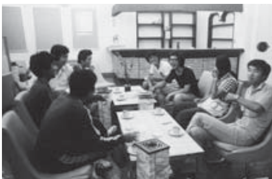
▲若者が集う市勤労青少年ホーム（昭和50年4月）