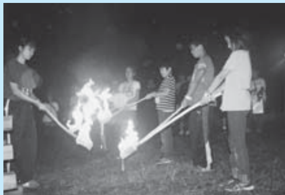
▲夜のお楽しみキャンプファイヤー

7月27日から30日までの4日間、本校の6年生と、新宿区立四谷小の6年生、計40人が参加して、夏の交歓会が行われました。 初日は、干布小での歓迎会の後、奈良沢不動尊キャンプ場へ向かいました。班ごとに協力してテントを設営した後、夕食のカレーを作りました。飯ごうで炊いたご飯と具だくさんのカレーは最高に美味しいと好評でした。 2日目は、お昼に流しそうめんとマストつかみ、夜はキャンプファイヤーを行い、両校の子どもたちの距離がぐっと縮まりました。 3日目は、書き駒体験や紅花染