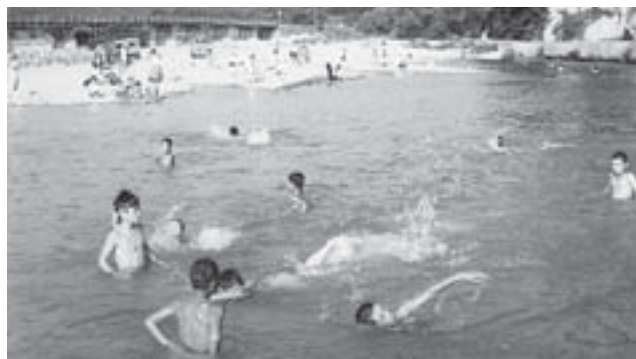
▲市内川原子にあった川を利用したプール（昭和35年7月）