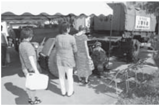
▲大雨による断水が街を襲った（平成25年7月）