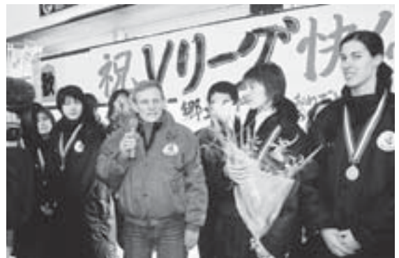
▲パイオニアレッドウイングス優勝凱旋セレモニー（平成16年3月）