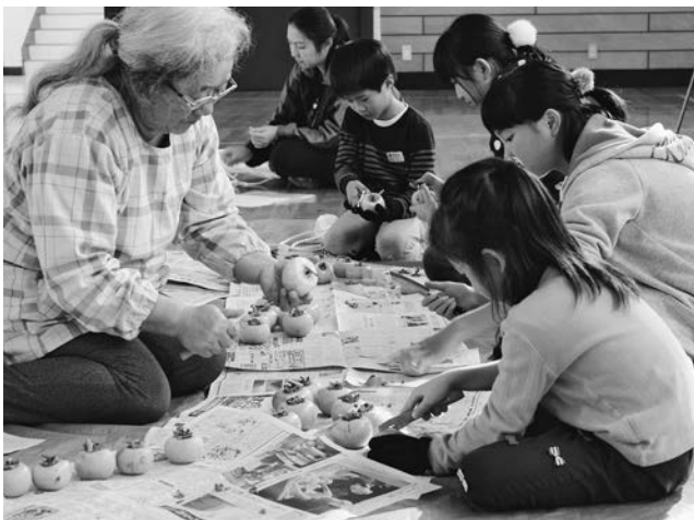
みんなで頑張って柿の皮むき