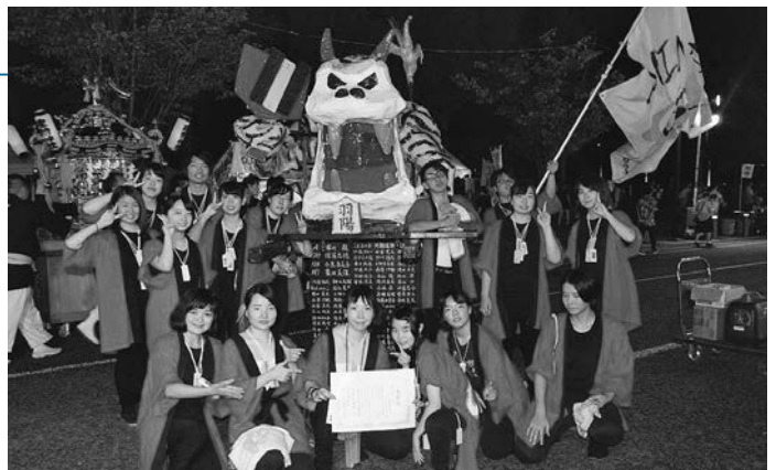
▲天童のまちを一緒に練り歩いた神輿「虎」