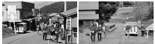
地域で守る伝統のお神楽