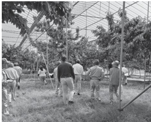
〈さくらんぼ作柄視察の様子〉