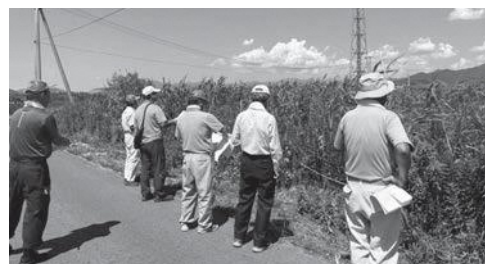
パトロールの様子（高嶺地区）

各都道府県に設置された公的機関であり、山形県では(公財)やまがた農業支援センターがその役割を担っています。離農や規模縮小などのため農地を貸したい農家から農地を借り受け、農業経営の効率化や規模拡大に意欲のある農家へ貸し付ける事業を行っています。