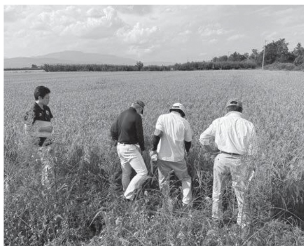
〈稲作作柄視察の様子〉