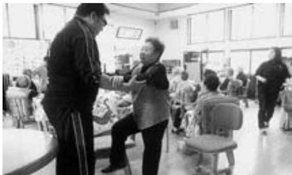
▲リハビリ中の要支援者