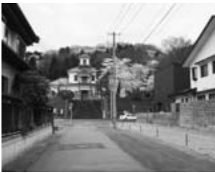
まちづくり交付金を利用した道路拡幅整備事業

用した北久野本・舞鶴山周辺両地区の本年度の事業内容は、 都市計画課長 北久野本に關しては、狹隘な路線の拡幅を3路線にわたり行い、ひかり公園の整備、耐震性貯水槽の設置などを行う。舞鶴山周辺では、旧郡役所資料館前から仲町の道路拡幅整備、トイレや案内板・照明などの設置により遊歩道の充実を図る。