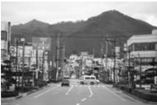
中心市街地の活性化が望まれる

よって、商店街及び中心市 街地の経営者に対し、計画の 性質を説明し、計画策定につ いて理解をもっと深めていた だき、機運が高まるよう働き かけていきたい。