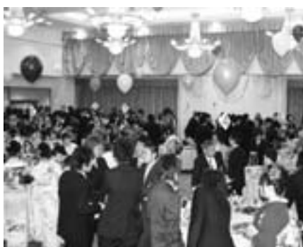
にぎやかに旧交を深める新成人

毎年参加率が8割を超えていることから、この方式が新成人や保護者に定着しているものと考えているが、運営方式については時代の趨勢を見ながら対応していきたい。