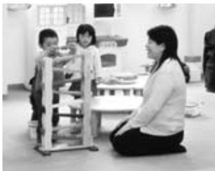
子ども達が自由に過ごしている「わらべ館」

しかし、各団体で代表を選 出し、自主的な運営を推進し ていただく方が、より効果的 と考えており、民間有識者の 活用を図るよう各団体と十分 な調整を進めていきたい。