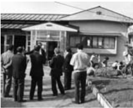
分譲予定の学童保育所を現地視察(環境福祉常任委員)

児童家庭課長 入所児童が71名以上の大規模になると、分離が必要となることから、児童南部学童保育所、児童中央学童保育所、長岡よつば児童クラブについては、施設を新設し分離開業を行う。建物については、平屋建てで、60名程度収容できる施設を建設予定である。