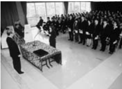
市長のリーダーシップで職員を指導

「仕事は厳しく、心は優しく」 である。職員には私の考えを 示した上で、協力を得ながら 全力で市政運営に取り組み決 意である。また、市民はお客 様であるとともに納税者であ ることや公務員は全体の奉仕 者であるという基本を再度確 認し、日々の業務の中で、私 が実践を示しながら、職員の 意識改革を進めていきたい。