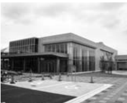
病後児保育機能を設置した健康センター

児童家庭課長 健康センター内に病後児保育室を設置し、病気の回復期にあり家庭や集団での保育が困難な児童を一時的に保育する。市の直営で看護師・保育士を配置する。