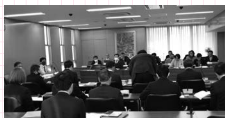
▲委員会審査（予算特別委員会）