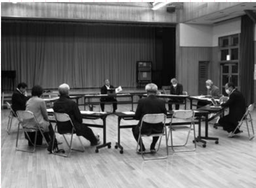
▲各公民館ごとに行われた議会報告・意見交換会