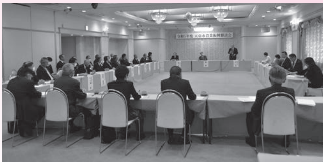
▲これからの農業を語り合う

懇談会では、農業委員会が市長に提出した意見書の内容をテーマに話し合いが行われました。意見書には、担い手への農地の集約化、遊休農地対策や新規就農の促進、農道整備、鳥獣被害対策、資材等の価格高騰対策などの農業を取り巻くさまざまな課題についての対策が盛り込まれており、参加した委員は、本市農業の現状を確認しながら、活発な意見交換を行いました。