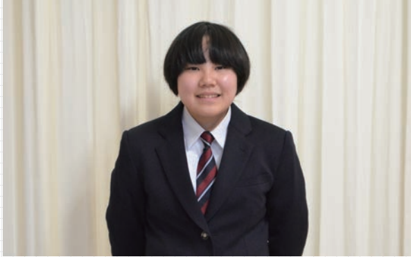
▲かわいらしい作品を提供していただきました！