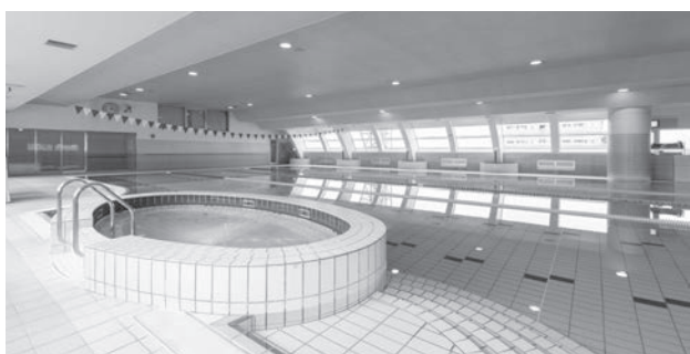
▲市民の健康増進を目指す（天童市健康増進施設）

康増進を図るために市が設立した第3セクターであること、2点目は指定管理期間が2年間という臨時的な取り扱いのため、今まで施設を管理していたところが望ましいこと、3点目は利用者数の増加に向けた取組みを市が行おうとする際に、こうした変更に対応しやすい、という点である。 審査は、同団体が提出した指定申請書の内容に基づいて、指定管理者の候補者選定審査会で行った。