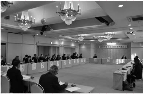
▲さまざまな場所で市民の声を聴いている

こうした仕事をどう進めるかを決める際に、住民全員で話し合うことは難しいため、選挙で選ばれた市民の代表者である議員が代わりに話し合いを行います。この代表者の集まる場が市議会です。