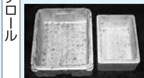
もやせるごみに出す発泡スチロール

4月1日からごみ分別が一部変更され、汚れた発泡スチロールは「もやせるごみ」から「もやせるごみ」に変更になりました。次のいずれかに当てはまる場合は、「もやせるごみ」に出してください。