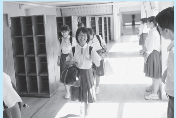
▲爽やかなあいさつで笑顔の登校

本 年度の三中生徒会スローガンは、全力で最高の学校を創るという意味を込めて「BEST」を掲げました。「B」はbelief（信頼）、「E」はeveryone（みんな）、「S」はserious（真剣）、「T」はteam（チーム）という、三中生が大切にしたい言葉の頭文字をつなげたものです。そして、次の三つの活動方針で取り組んでいます。一つ目は、「全員参加の生徒会」です。新しい活動である全校合唱など、全校生徒が力を合わせて活動に取り組んでいます。全員が一つのチームで同じ目標に向かって活動することで、より良い学校・校風を創ることを目指しています。