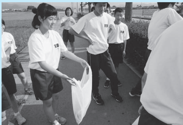
▲学年オープン縦割り班で取り組んだボランティア活動

二つ目は、「何事にも真剣・全力」です。行事の他、普段の学校生活から何事にも一生懸命に取り組むことを大切にしています。あいさつを推奨し、執行部を中心にあいさつ運動に取り組んでいます。三つ目は、「人と人とのつながり」です。人とのつながりを感じる活動をとおして、居心地の良い安心できる学校を創ることを目指しています。兄弟学級の縦割り班で協力して全校ボランティアに取り組み、部活動以外でも先輩と後輩と一緒に活動することで、新しいつながりが生まれています。これからも、三中生全員でより良い最高の学校を創っていきます。