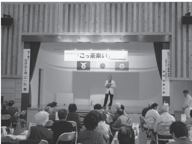
健康講話や軽体操などをして交流を行います