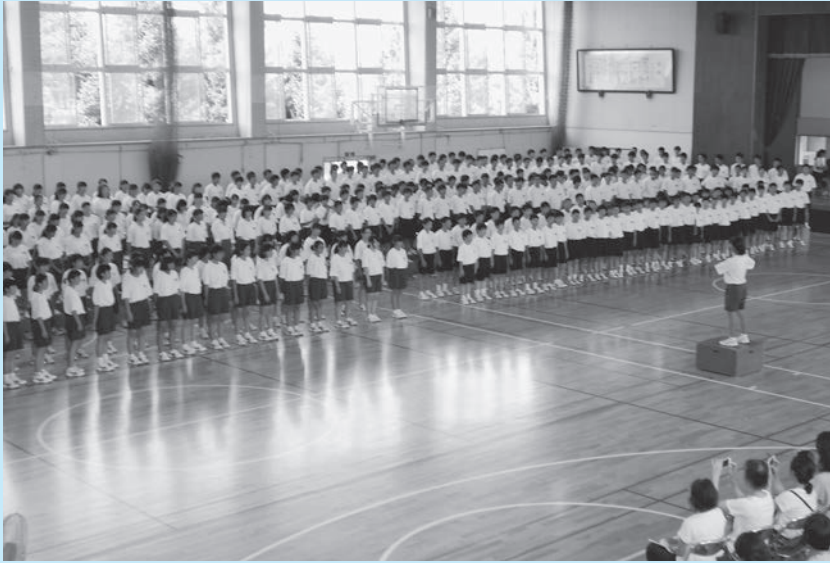
▲三中生全員で創り上げた全校合唱

三中生徒会の平成30年度スローガンは「BEST」です。スローガンに込めた思いを実現するために、生徒一人一人がよりよく考え判断しながら、全校生徒が一丸となって取り組んでいます。今回は、活動方針について紹介します。